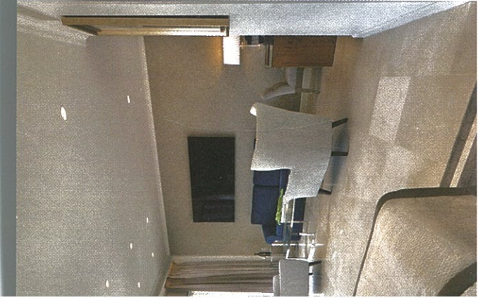
כזה, וא שילבתי המהות

ואכן הצלחתו של חסון ניכרת מיד בכניסה, כשהחלוקת הלובי לפונקציות השונות מתבצעת ללא כל מחיצות אלא לפי אופן הצבת הרהיטים בלבד. רצפת השיש המינרלי, במגוון השמט, משתלבת במדויק עם גווני השמט, הקפה, הכתול, חום האנזו הניכר בריהוט והפליז המבצבץ במעקות הבטיחות ובפרטי קישוט גדולים וקטנים.